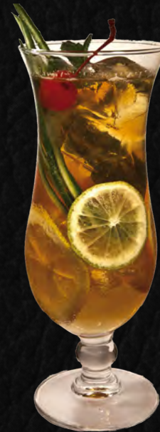
PIMS NO 1