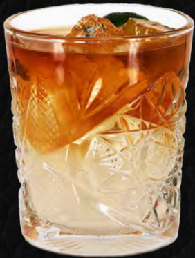
DARK & STORMY

Hier sehen Sie eine kleine Auswahl der Drinks die im Fun-Mix-Kurs der Barfachscheule Zürich gemixt und degustiert werden.